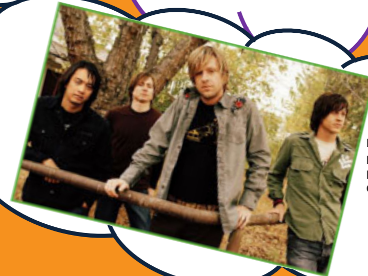
Hillsong United se prepara para lanzar su próximo disco a finales de año.