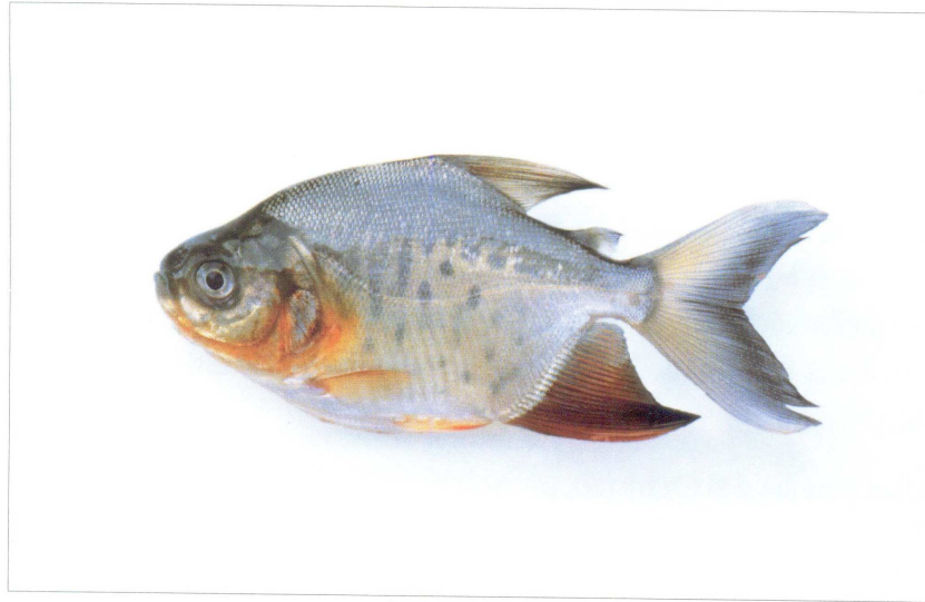
FIGURA 2. Colossoma macropomum , juvenil de Cachama de 80 mm de largo, su patrón de coloración es muy similar al del caribe colorado con el cual mímétiza. Esteros de Camaguán, estado Guárico.