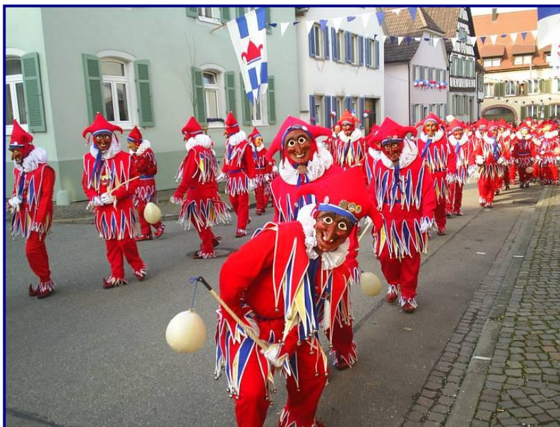
Fotografía 1. El ajuar de un Jokili

El resto de los accesorios son similares a los utilizados en Alemania. El cuello de color blanco, los zapatos de cuero rojo con un cuerno, el gorro de tres puntas y los guantes blancos. Estos, señala Muttach, son confeccionados por costureras de la zona y por artesanos del estado Aragua. Quizás los únicos accesorios que no son fabricados en el país son la vara de madera torneada “ Schtacka ” (palo), a la cual se ata la vejiga de cerdo, y el broche de metal con el que se sostiene la máscara.