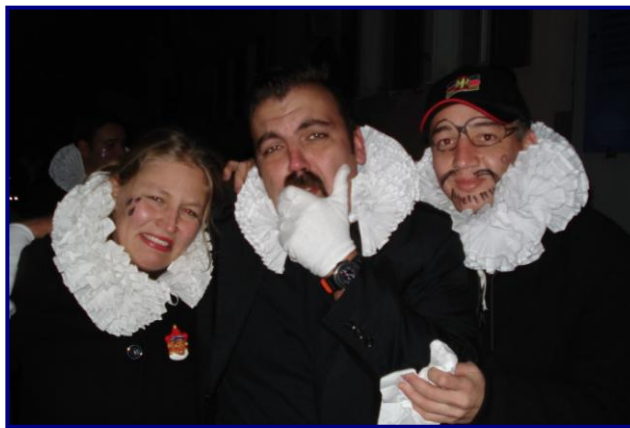
Fotografía 6. Desfile de la tristeza en el 2007

Todo llega a su final el martes de carnaval. Ese día puede observarse a cuatro de los jokilis paseándose por el pueblo, pero esta vez con un traje negro, blanco y gris. Ellos dejan de un lado el rojo que simboliza la alegría de las fiestas para mostrar el luto que anuncia la muerte del espíritu del carnaval. Esa noche los habitantes del pueblo y miembros del grupo se visten del color de la tristeza, para entre sollozos y lágrimas realizar la ceremonia de entierro en la que se regresa al arlequín a la fuente para que descanse, pero sólo hasta el próximo año.