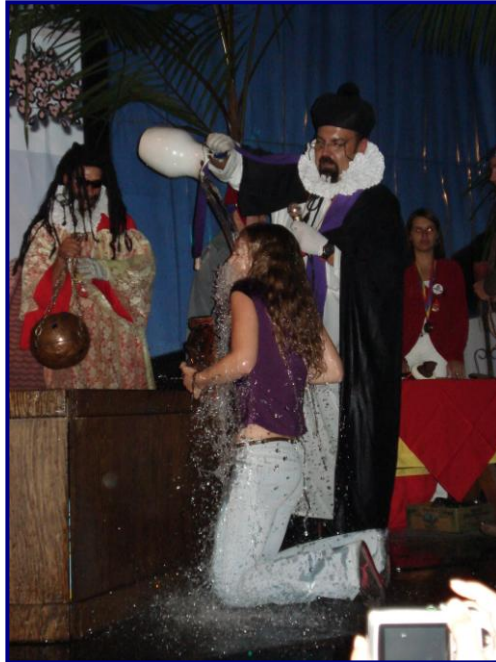
Fotografía 5. Ceremonia de Bautizo 2007

porque la gente de aquí y de afuera lo disfruta mucho, nosotros le ponemos el toque venezolano, es que la mamadera de gallo no es normal”.