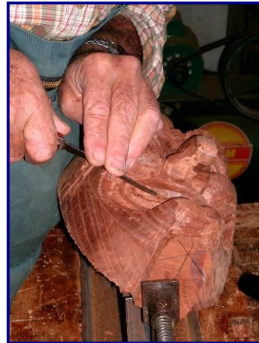
Fotografía 3. Retoque final