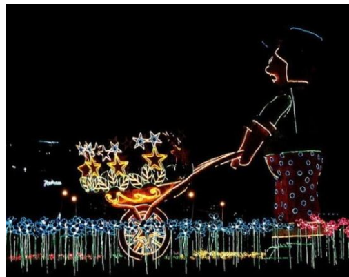
Tributo a Pacheco en navidad