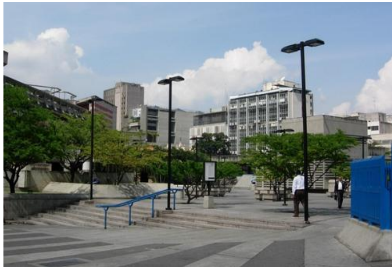
Plaza Juan Pedro López, se aprecian los cujés Banco Central de Venezuela