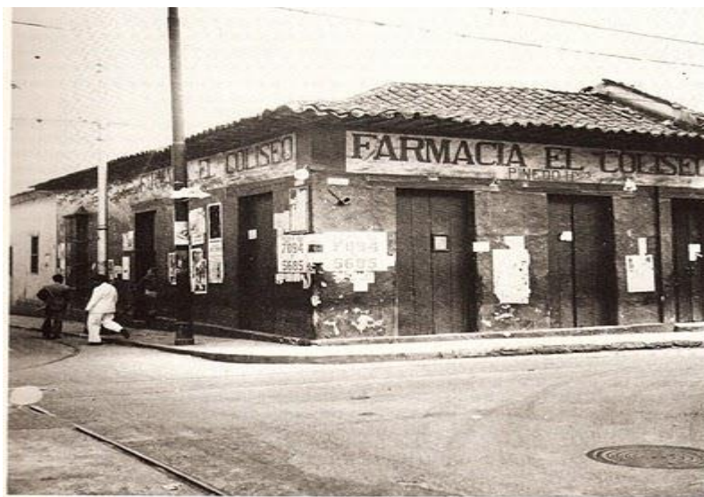
Esquina del Coliseo, hacia 1940.

La Nomenclatura Caraqueña. Ediciones Petróleos de Venezuela