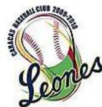
Caracas B.B.C. 1895