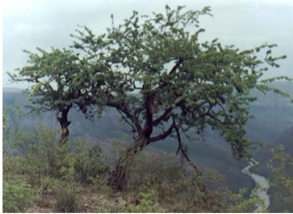
Árbol de Cují