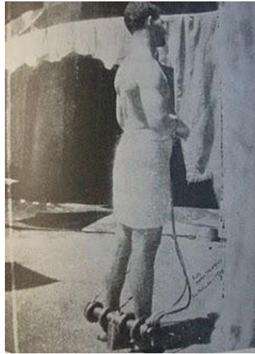
Grillos o grilletes