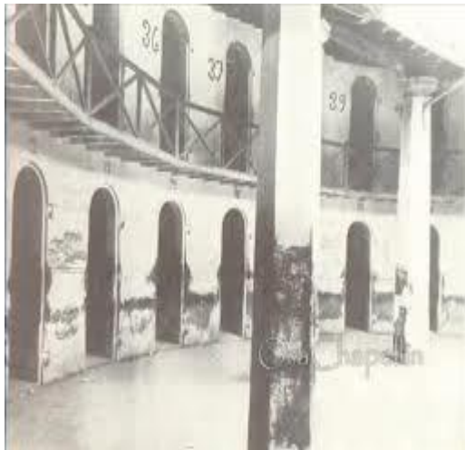
La Rotunda por dentro