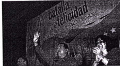
Chávez pidió que se construyan escuelas de educación integral