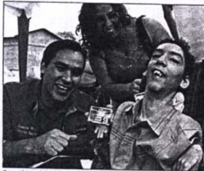
Garantizan el derecho a la identidad a estos ciudadanos. CARLOS RAMÍREZ

Así lo anunció el director general del Servicio Administrativo de Identificación, Migración y Extranjería, Dante Rivas, durante el operativo realizado ayer en el Parque Ali Primera, donde informó que cuentan con 36 módulos que serán operados por dos funcionarios del Saime, para trasladarse a hospitales, clínicas y lugares donde se encuentran las 8 mil 881 personas en situación