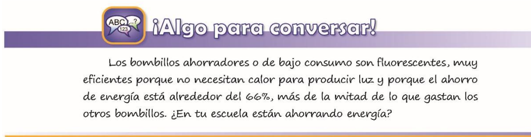
Figura 1. Uso bombillos ahorradores (4to grado, pág. 161)

Se examinaron las seis unidades dedicadas a la estadística en los seis textos escolares de matemática de la CB, una unidad para cada grado. Los textos escolares no tienen introducción o presentación, así como tampoco tienen sugerencias para los maestros, por tanto, se puede suponer que se trata de un libro para uso del estudiante. El número de páginas por unidad varía de 6 a 10. Las unidades siempre están identificadas con un nombre, el cual está asociado a un tema donde se enmarcan las explicaciones de los contenidos matemáticos, como un recurso para darle un contexto a ese contenido. Por ejemplo, la unidad de Estadística de cuarto grado se denomina ¡No agotemos los recursos naturales! , las explicaciones y actividades se enmarcan en temas como los recursos naturales, el desarrollo sostenible y el ahorro de energía, tal como se puede apreciar en el siguiente ilustración.